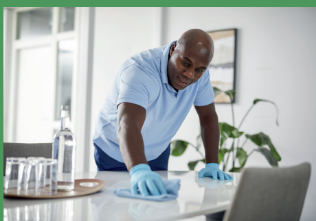
Panni in microfibra